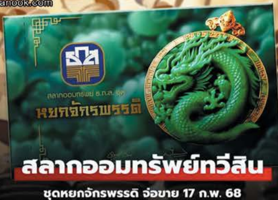
ชุดหยกจักรพรรดิ จัวยาย 17 ก.พ. 68